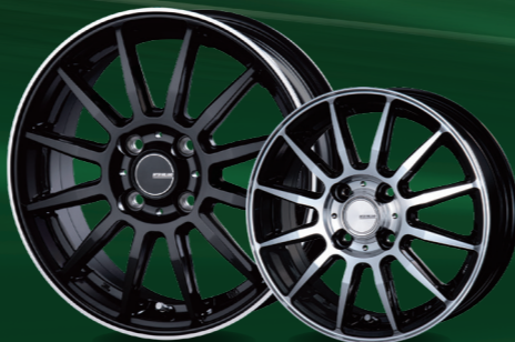
BK/FP 15x5.5 BK/P 14x4.5