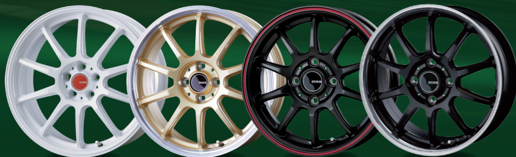
WH 18x8.0 GL/RP 17x7.0 MBK/FR 14x4.5 BK/RP 14x4.5