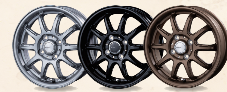
DS 14x4.5 GBK 14x4.5 BR 14x4.5