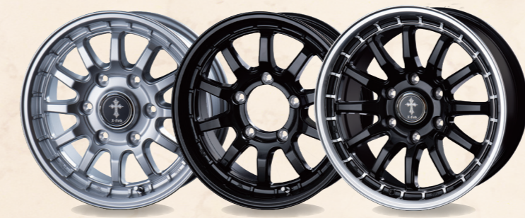
SI 15x6.0 BK 16x5.5 BK/RP 17x7.5